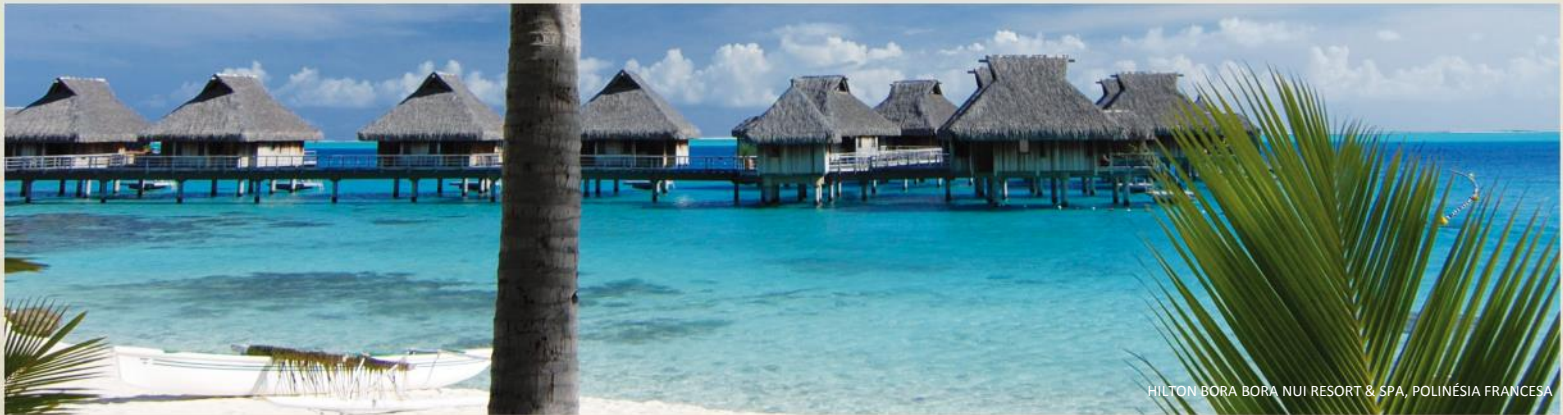
HILTON BORA BORA NUI RESORT & SPA, POLINÉSIA FRANCESA