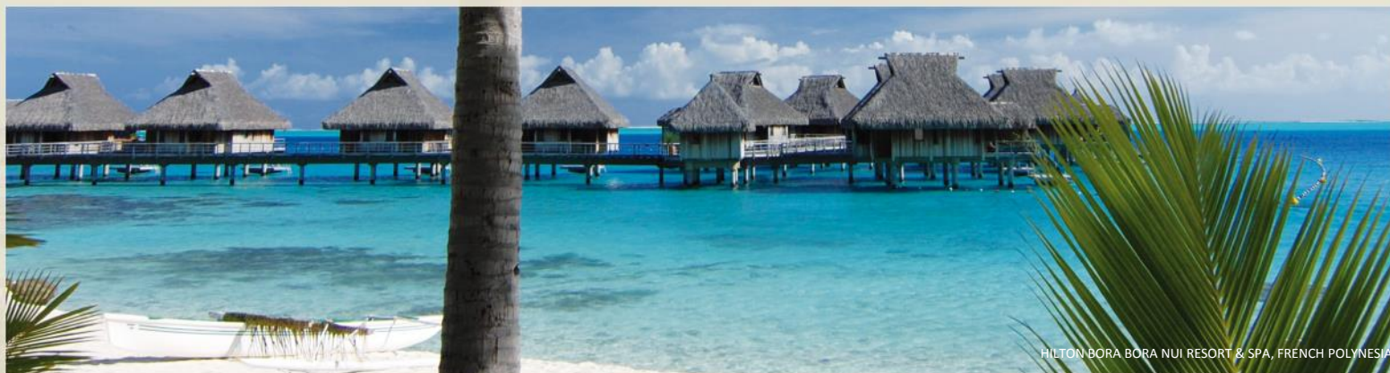
HILTON BORA BORA NUI RESORT & SPA, FRENCH POLYNESIA